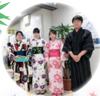
★ 2019年度 浴衣ボーイズ&ガールズ